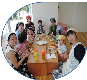
5/26（金）食育講座の様子 おいしくできたよ！